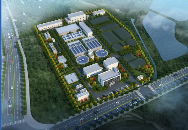
长沙临港产业开发区污水处理厂（一、二期）及配套基础设施工程-虞公港污水处理厂（一期）项目鸟瞰图

湘阴新隆建设投资开发有限公司向我局申请如图示红线图范围内进行“虞公港污水处理厂（一期）”项目建设。该项目位于长沙临港产业开发区虞公港产业园，项目一期总用地面积21952.45m 2 ，总建筑面积7475.54m 2 。具体经济技术指标如图所示。根据住建部《关于城乡规划公示公开的规定》第三章第二十条以及《湖南省实施〈中华人民共和国城乡规划法〉办法》第二章第二十条之规定，我局现依法将该项目规划与建筑设计方案向社会进行公示。公示时间为：2026年6月18日至2026年6月29日。相关利益人若有不同意见，请在公示日期内以书面的形式向我局提出意见或建议，逾期我局不再受理。